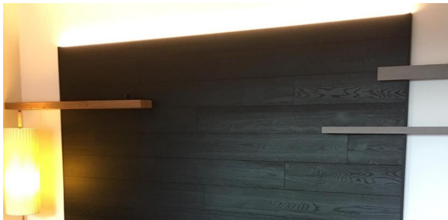
NERO sp. 15 mm