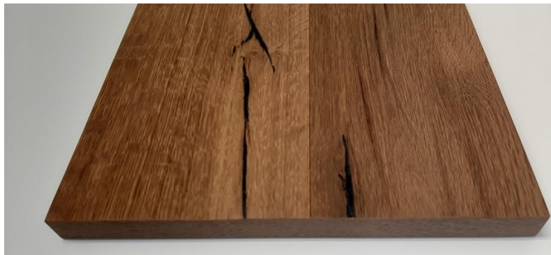
Mensola in TERMOCOTTO spessore 25 mm. bordata