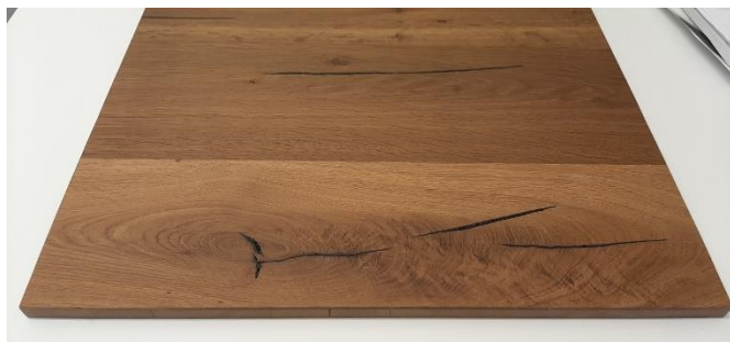
TERMOCOTTO spessore mm. 19